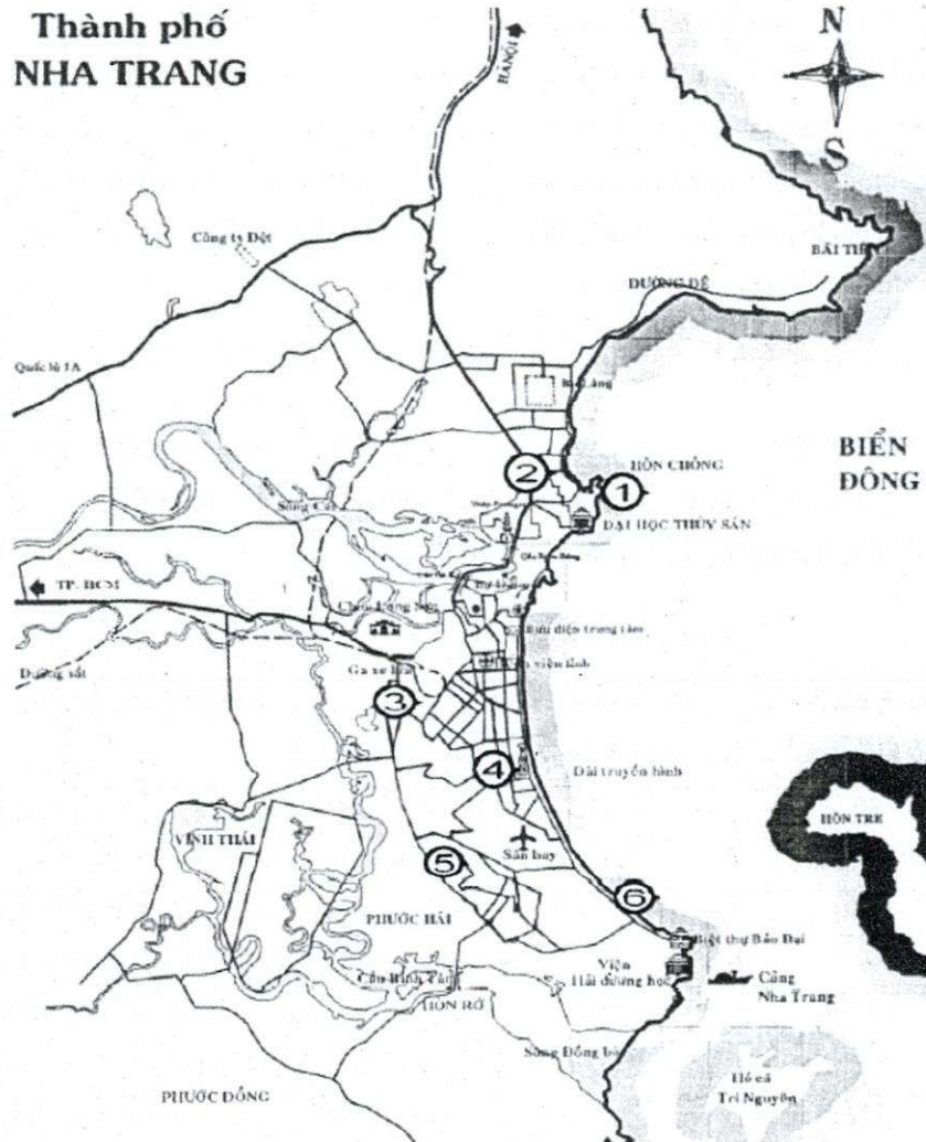
Hình 1. Sơ đồ bố trí các địa điểm thu mẫu clorua và thử nghiệm ăn mòn thép 1 – Trạm thử nghiệm Hòn Chông; 2 – Trường Dân tộc Nội trú; 3 – Trạm truyền tải điện; 4 – Chi nhánh Ven biển, Trung tâm Nhiệt đới Việt-Nga; 5 – Trạm Thông tin; 6 – Cảng Hải quân