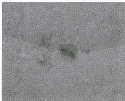
Hình 1. Một số hình ảnh vết đen Mặt trời chụp ở ĐHSP TP HCM

Những hình ảnh chúng tôi chụp được hoàn toàn giống như hình ảnh VĐMT do các đài thiên văn lớn trên thế giới, với thiết bị hiện đại hơn rất nhiều đã thu nhận, được truyền tải trên mạng. Xin xem ảnh so sánh dưới đây: