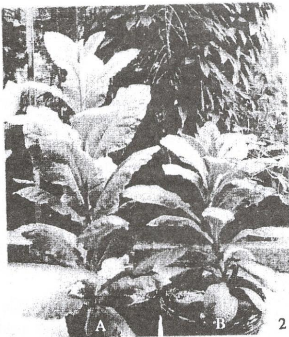
Ảnh 2: Ảnh hưởng của GA 3 lên sự tăng trưởng của cây thuốc lá trồng ở vườn thực nghiệm. A: GA 10mg/l, B: đối chứng