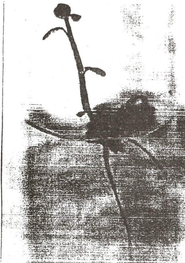
Ảnh 1: Cây con tạo thành từ mô sẹo lá Khoai tây.

Cây con xuất hiện và phát triển tốt trên môi trường MS sau 3 tuần nuôi cấy (Ảnh 1) nhưng tỉ lệ rất thấp (10%). Trên môi trường có bổ sung zeatin 2mg/l sau 1 tuần chuyển sang môi trường không có chất điều hòa tăng trưởng thực vật cây con xuất hiện sau 3 tuần với tỉ lệ rất cao (100%). Trên các nghiệm thức còn lại không thấy có sự xuất hiện của cây con (Bảng 1).