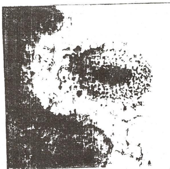
Ảnh 3: Phôi trưởng thành từ thí nghiệm thứ 4, với sự phân cực chồi và rễ rất rõ nét.