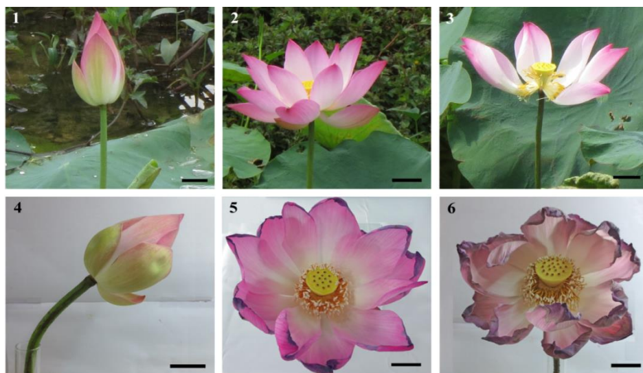
Hình 1-3. Các giai đoạn tăng trưởng và nở hoa của hoa sen trong tự nhiên: Nụ tăng trưởng đầy đủ ở ngày 0 (Hình 1), hoa nở hoàn toàn ở ngày 3 (Hình 2) và hoa lão suy ở ngày 4 (Hình 3) (thanh ngang 3 cm).