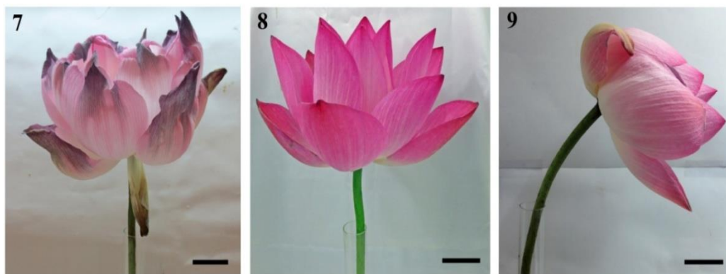
Hình 7-10. Hoa sen sau 24 giờ ở các nghiệm thức: đối chứng (Hình 7), gây héo 5% (Hình 8) và gây héo 10% (Hình 9) (thanh ngang 3 cm).