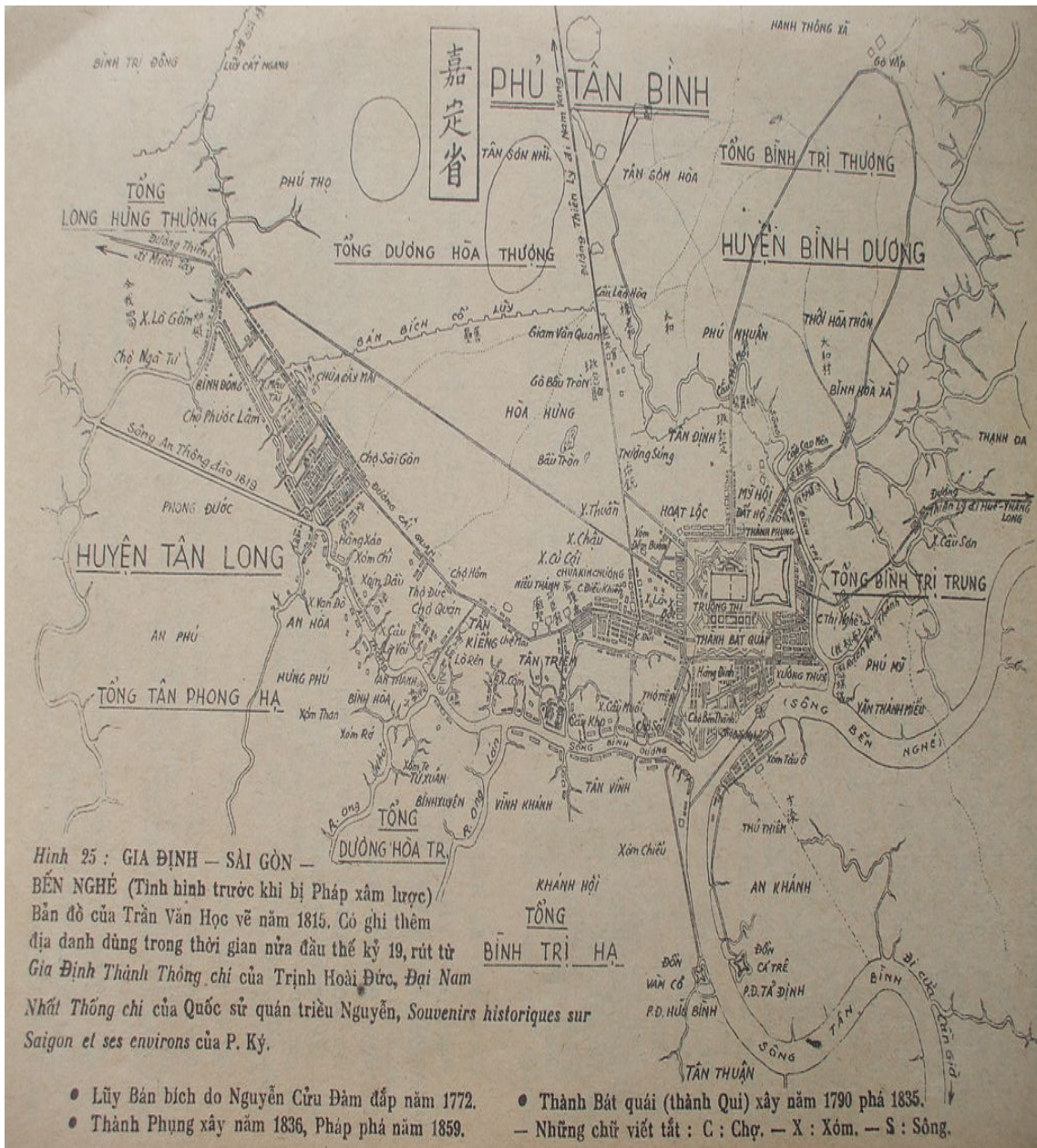
Hình 1. Bán Bích cổ lũy trên bản đồ Gia Định 1815 do Trần Văn Học vẽ